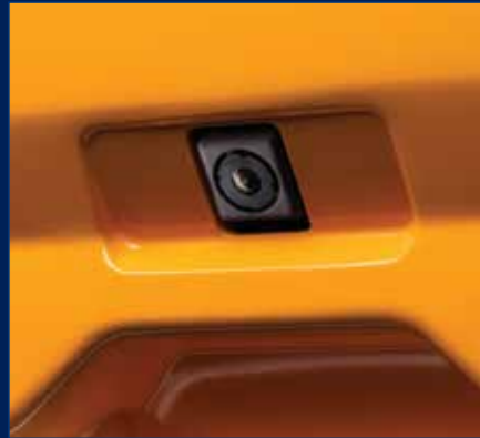
Rückfahrkamera für mehr Sicherheit

Sichtbarkeit ist das A und O bei der Arbeit, deshalb kann der HW65A optional mit einer Rückfahrkamera ausgestattet werden.